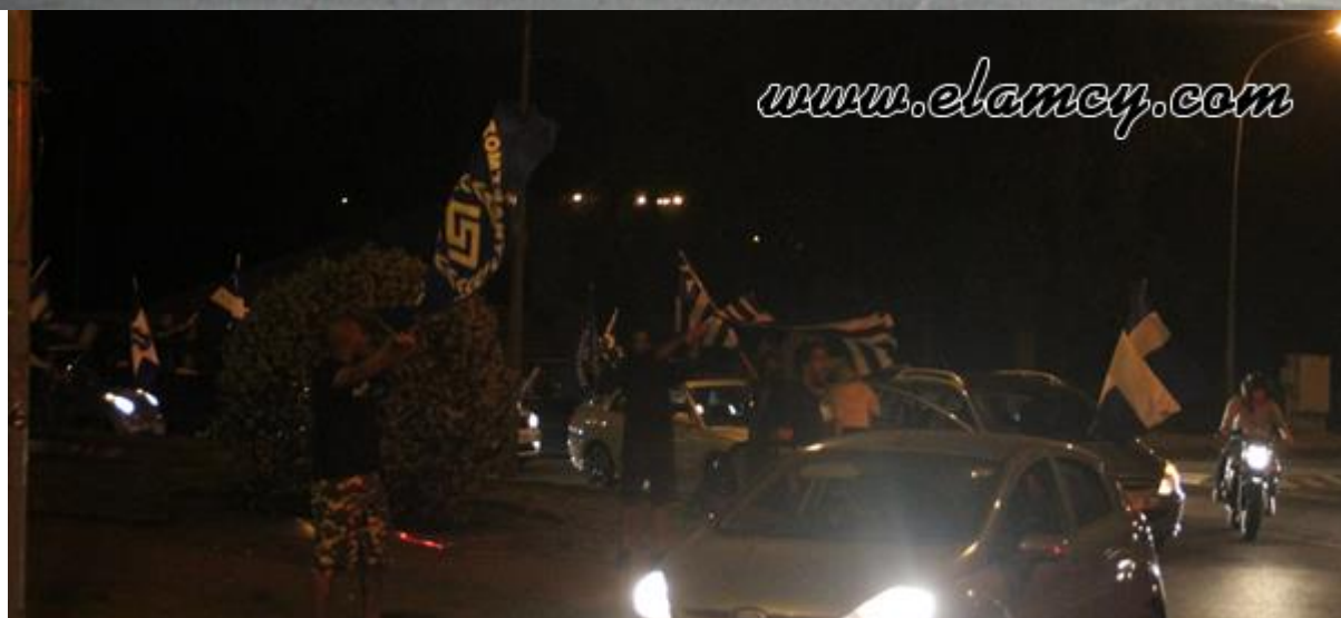
Πανηγυρισμοί ΕΛΑΜιτών για την εκλογή της νέο-ναζιστικής Χρυσής Αυγής στο Ελληνικό κοινοβούλιο, Μάης 2012.